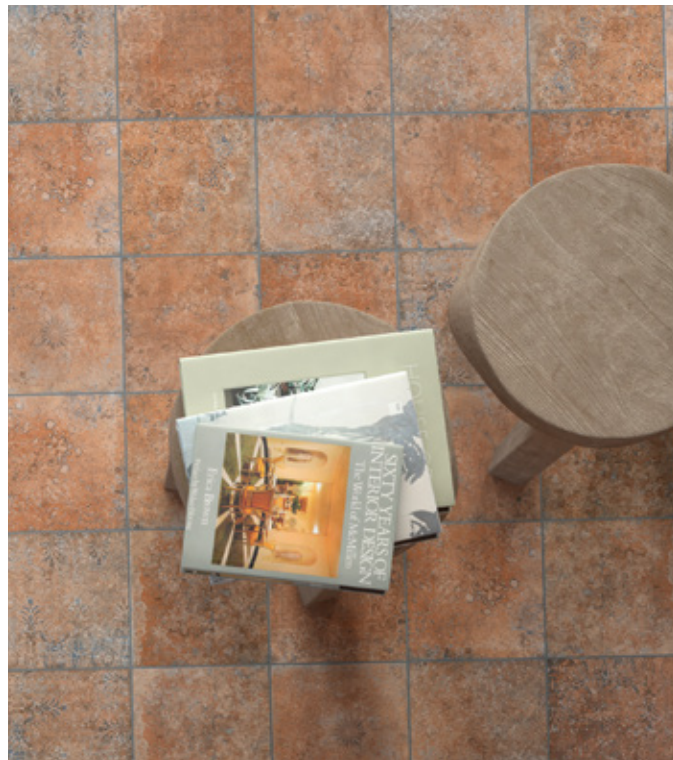
Toscana Terracotta Decor R9