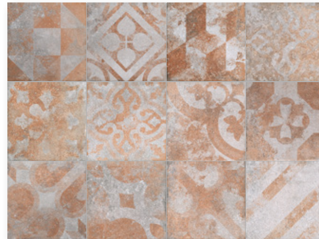
Toscana PW Terracotta R9 Toscana PW Terracotta T R11