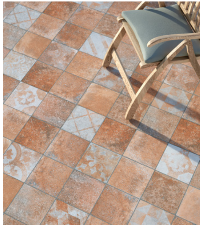
Toscana Terracotta T R11 Toscana PW Terracotta T R11