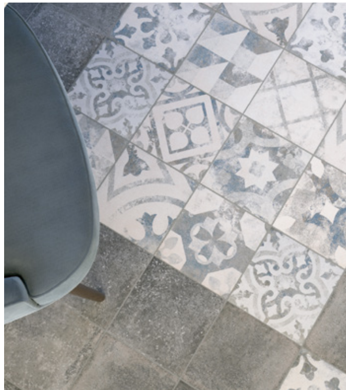
Toscana Nero R9 Toscana PW Azzurro R9