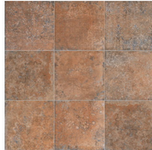
Toscana Terracotta Decor R9