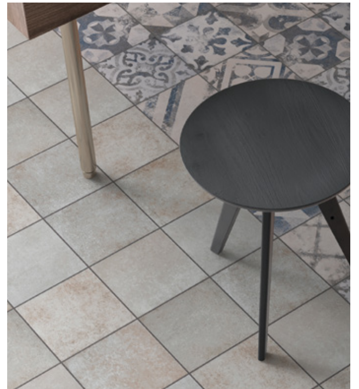
Toscana Calce R9 Toscana PW Azzurro R9