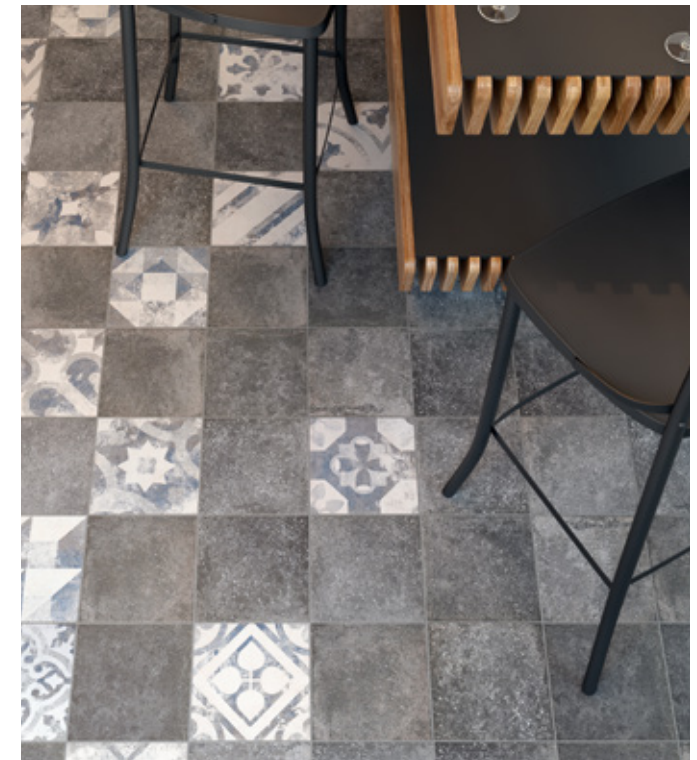
Toscana Nero R9 Toscana PW Azzurro R9