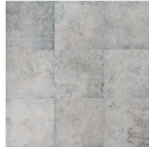
Toscana Grigio Decor R9