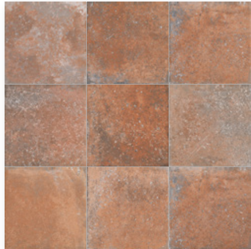
Toscana Terracotta R9 Toscana Terracotta T R11