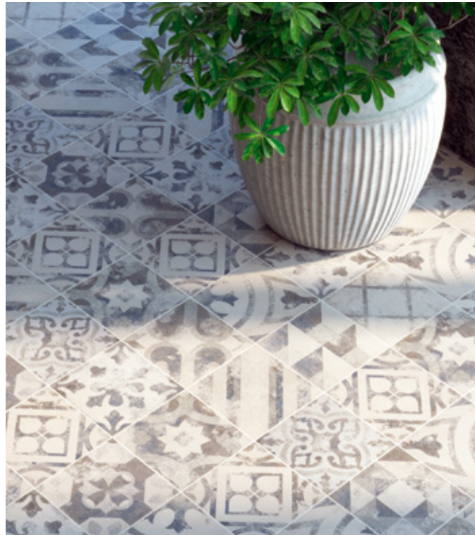
Toscana PW Azzurro R9