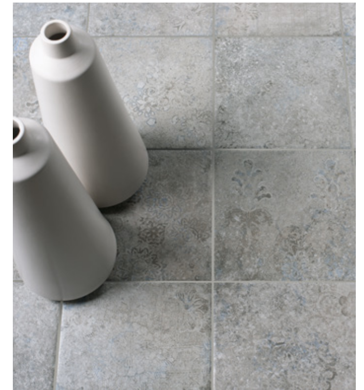
Toscana Grigio Decor R9