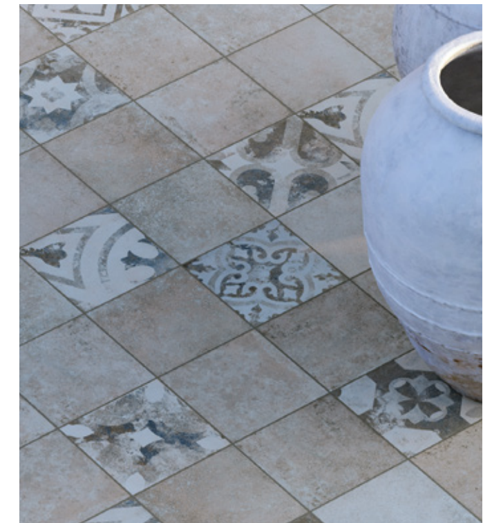
Toscana Grigio T R11 Toscana PW Azzurro T R11