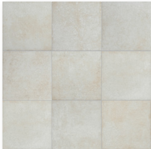
Toscana Calce R9 Toscana Calce T R11