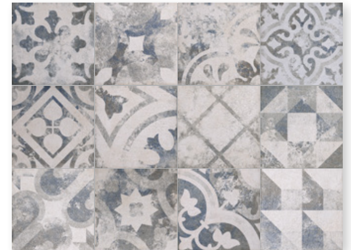
Toscana PW Azzurro R9 Toscana PW Azzurro T R11