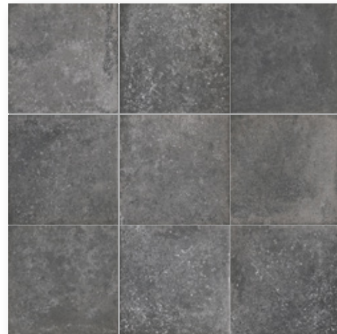
Toscana Nero R9 Toscana Nero T R11