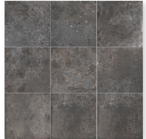
Toscana Nero Decor R9